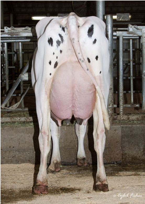
SIEMERS TRJ BROOKE 28046

L-R SIEMERS TRJ BROOKE 28046, SIEMERS TRJ BROOKE 28030, SIEMERS TRY BROOKE 28066