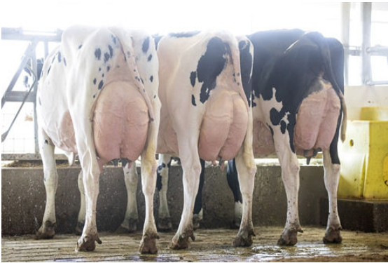
SIEMERS TRAJECTORY DAUGHTER GROUP

L-R SIEMERS TRJ BROOKE 28046, SIEMERS TRJ BROOKE 28030, SIEMERS TRY BROOKE 28066